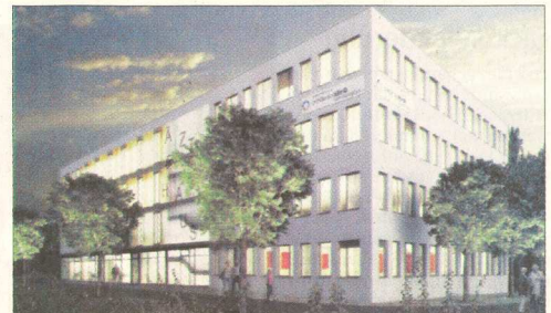
So wird das Ärztehaus in Weingarten aussehen: Mit Fachpraxen, Apotheke, Sanitätshaus, Sozialstation und dem großen Klinik-Parkplatz.